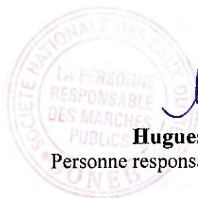
Hugues MEHOU Personne responsable des marchés publics